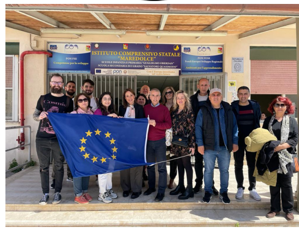
Vizită la Școala Primară "Maredolce"

Evenimentul următor: activitatea de formare a 4 profesori/instituție parteneră în Trikala -Grecia (iulie 2023)